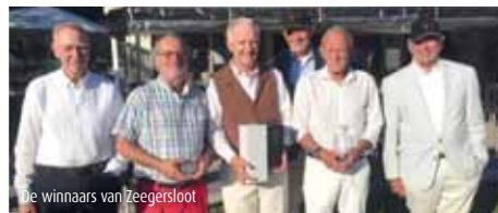
De winnaars van Zeegersloot