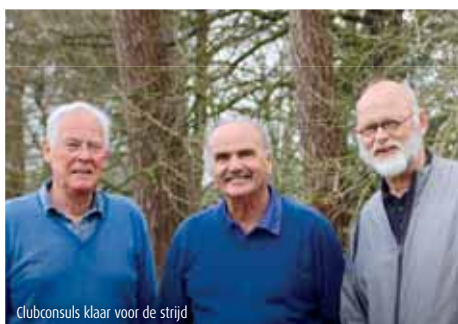
Clubconsuls klaar voor de strijd

Na de gezellige Consulbijeenkomst 's ochtends starten 107 grootvaders de jaarlijkse Consulwedstrijd om de 'felbegeerde' Jelle Tjaden Trofee.