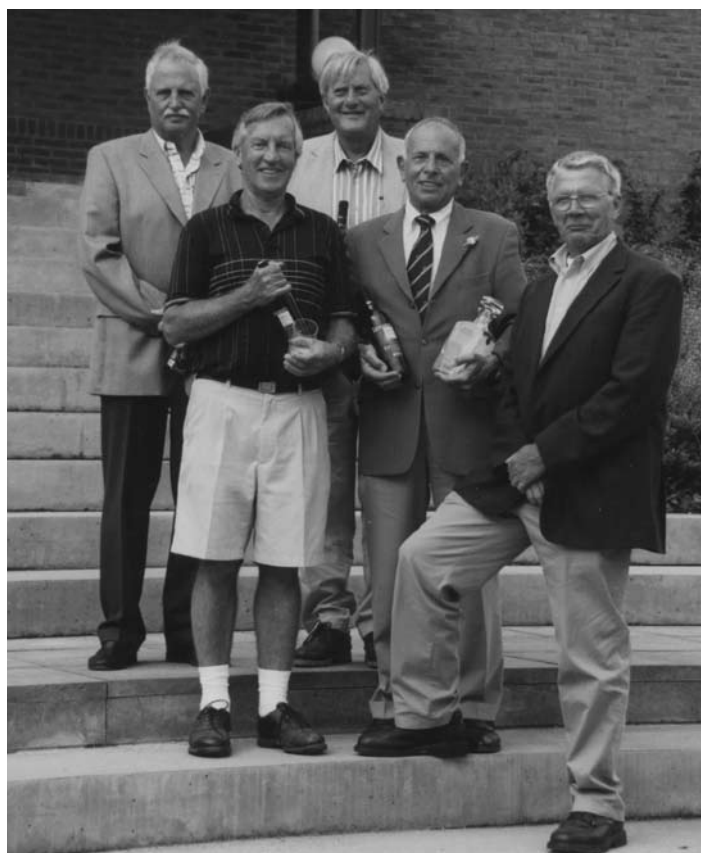
Op de 9 holesbaan van Veldzijde waren dit de winnaars.

ABN AMRO Bank nr. 41.20.51.095 Postbank 3266722 Tnv Stichting Old Grand-Dad Club te Voorthuizen