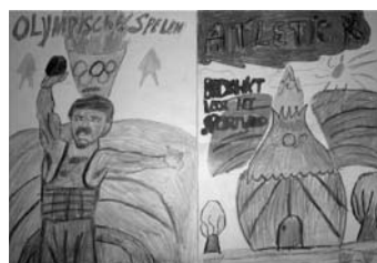
De jeugd van OZC/Amstelmonde maakte als dank voor de schenking van het sportveld deze tekening voor de OGD

De woongroepen in Driehuis zijn zeer intensieve behandelgroepen welke plaats bieden aan kinderen die doorgaans zijn vastgelopen in alle leefmilieus of dat dreigen te doen. De kinderen zijn afkomstig