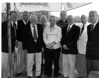
Midden Brabant stuurt bovenstaande winnaars naar de Landelijke Finale.