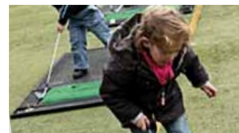
Terwijl de Grootvaders hun golfronde speelden, oefenden de kleinkinderen op de drivingrange.

de eigen lokale OGD-wedstrijd wat op te vrolijken.