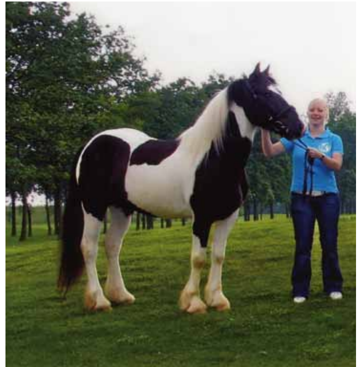
Eén van de Tinker-paarden die de OGD schonk

Voor de Stichting was dit alles aanleiding om met de twee Tinkerpaarden naar de golfbaan te komen waardoor OGD-contribuanten deze bijzondere paarden kregen te zien.