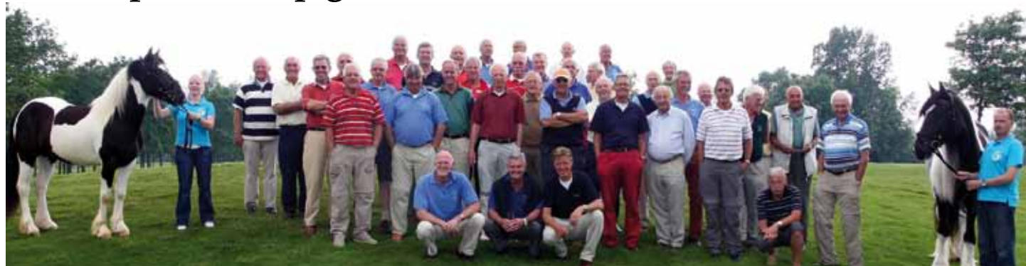
Het komt niet vaak voor dat een groot aantal Grootvaders geconfronteerd wordt met de gift die de OGD heeft geschonken. Op Golfbaan Grevelingenhout werden de OGD-ers geflankeerd door twee Tinker-paarden (lees meer in dit Jaarbericht)