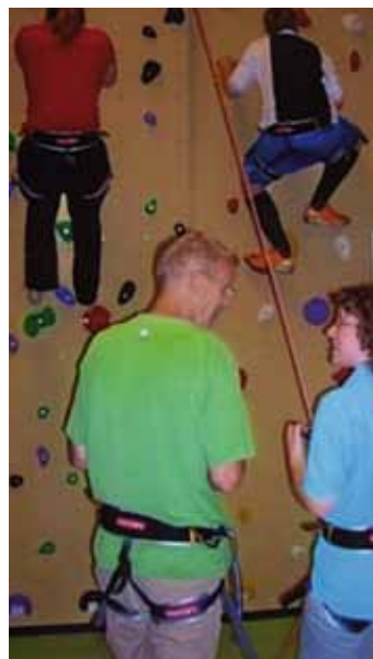
Een klimwand draagt bij tot het krijgen van een groter zelfvertrouwen

“We werken toe naar vraaggestuurd onderwijs (we gaan uit van de vragen/problemen van de leerling) en geven ondersteuning die is gericht op de individuele behoeften en mogelijkheden van leerlingen. Daar-