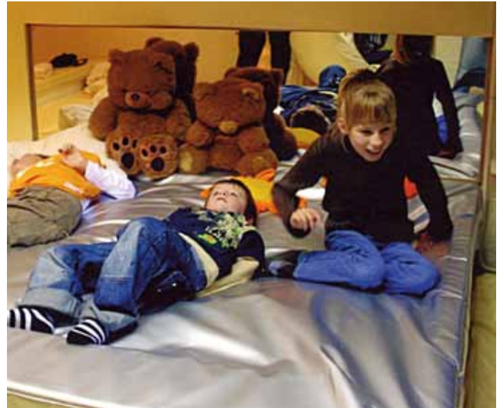
Het waterbed voldoet volledig aan de verwachtingen

Daarnaast is een deel van de gift besteed aan diverse materialen voor kindervervoorziening de Pollux in Hoogeveen. Er is onder andere een spelcomputer en digitale camera aangeschaft.