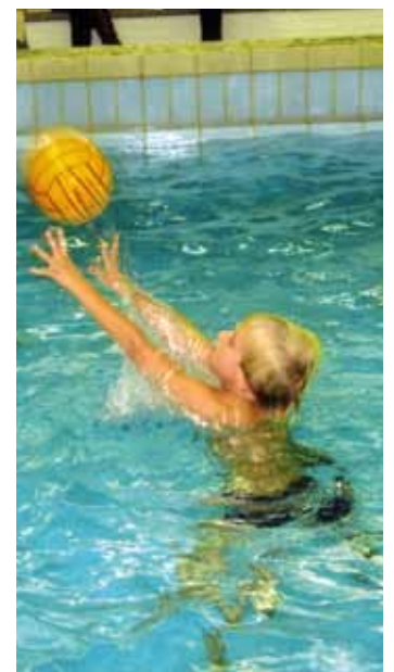
Waterbasketbal als nieuwe uitdaging

toekomst zullen ongetwijfeld nog meer investeringen volgen voor b.v. de uitbreiding van de zwembaduren. Sc Bartje zal in de toekomst dus nog wel meer van zich laten horen.