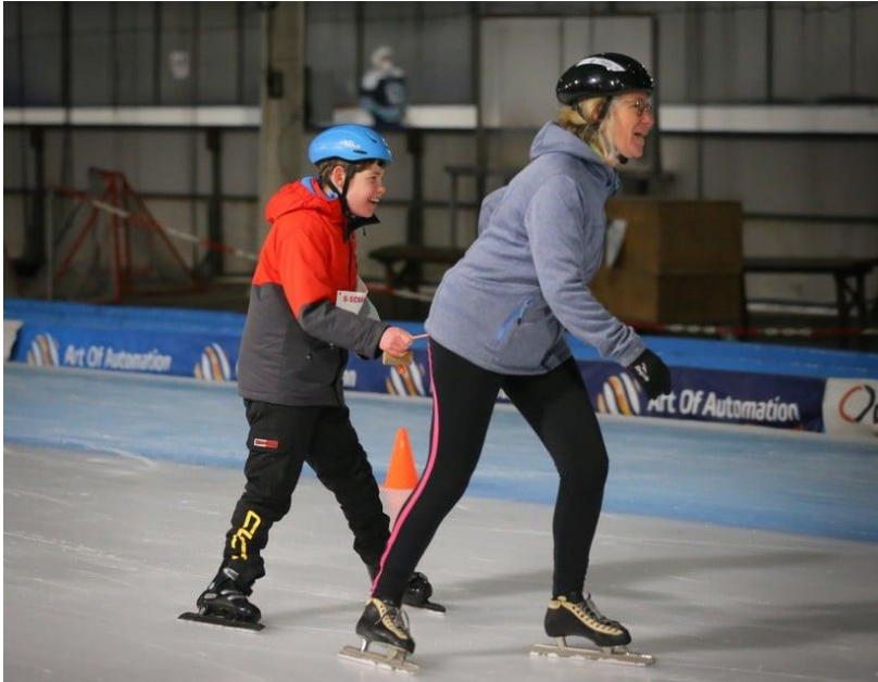
Een deelnemer laat zich voorttrekken door de begeleider.