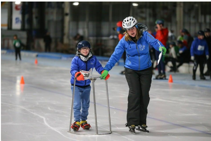
Zo kom je ook bij de finish.